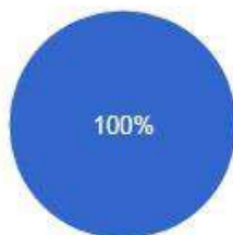
Solicitantes PF - Escolaridade

● Até 29 anos ● Entre 40 e 49 anos ● Não informado