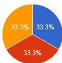
Solicitantes PF - Faixa Etária

● Até 29 anos ● Entre 40 e 49 anos ● Não informado